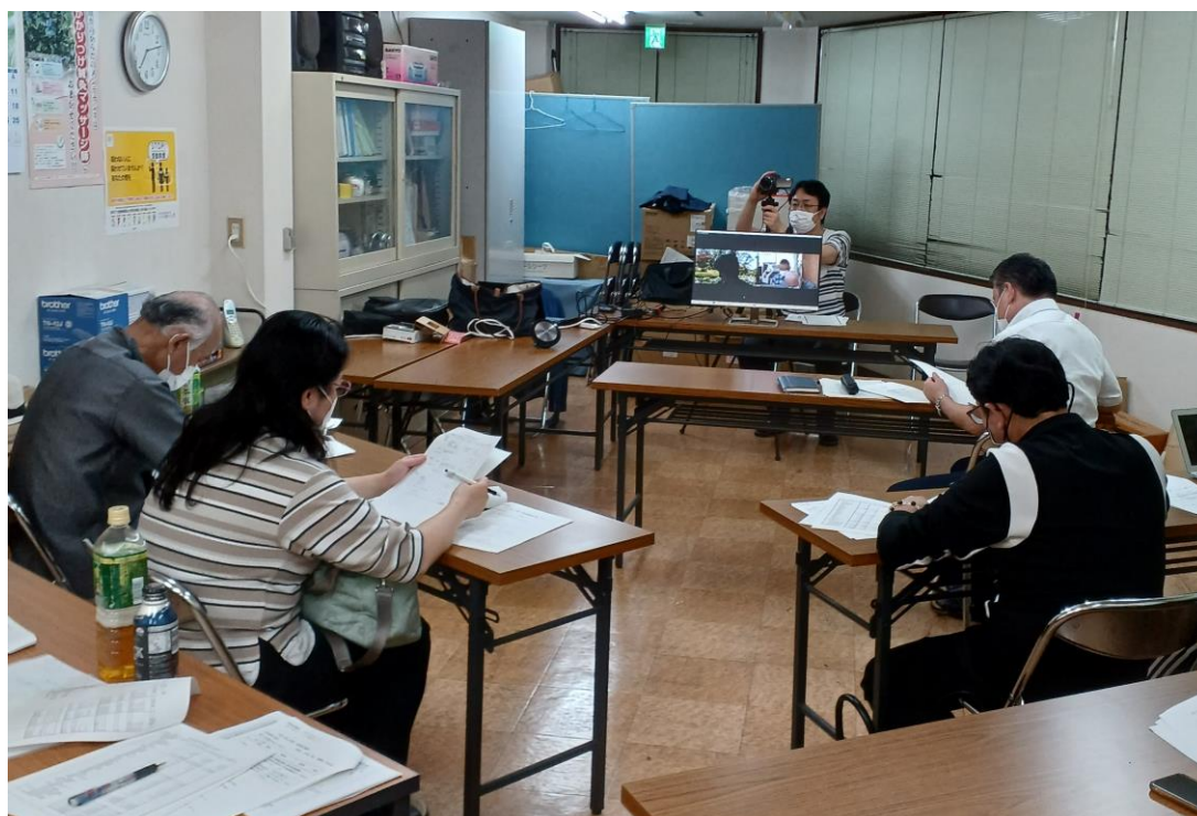
定期総会 本会事務所の様子